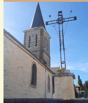
Église de Soues